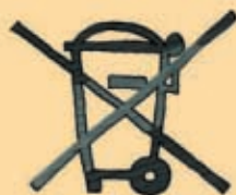
Déchets d'Équipement Électrique ou Électronique*