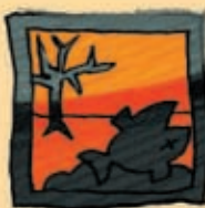
Polluant pour l'environnement